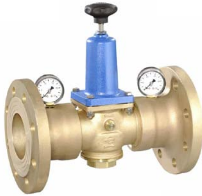
(DRV 502-6) DN 40 - DN 80

Η εταιρία Berluto προσφέρει βιομηχανικούς μειωτές πίεσης φλαντσοτούς από DN 15 έως DN 125. Είναι κατάλληλοι για χρήση σε υγρά, αέρια, χημικά κλπ. με επιλογή σε διάφορες πιέσεις εισόδου – εξόδου. Ανάλογα την περίπτωση προσφέρουμε μειωτές με το κατάλληλο κράμα. Καλύπτουμε όλους τους κλάδους της βιομηχανίας, όπως αυτούς των: τροφίμων, χημικών, καλλυντικών, διυλιστηρίων, κατασκευής πλοίων κλπ. Κατόπιν παραγγελίας προσφέρονται ειδικές κατασκευές με βάση τις ανάγκες των πελατών.