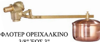
ΦΛΟΤΕΡ ΟΡΕΙΧΑΛΚΙΝΟ 3/8" ΈΩΣ 3" 1,9 ΈΩΣ 48 m 3 /h ΠΙΕΣΗ ΈΩΣ 12 bar ΘΕΡΜΟΚΡΑΣΙΑ ΈΩΣ 80 °C