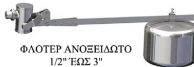
ΦΛΟΤΕΡ ΑΝΟΞΕΙΔΩΤΟ 1/2" ΈΩΣ 3" 3,7 ΈΩΣ 60 m 3 /h ΠΙΕΣΗ ΈΩΣ 12 bar ΘΕΡΜΟΚΡΑΣΙΑ ΈΩΣ 190 °C