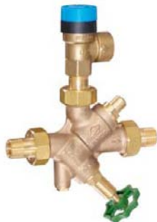
ΚΙΤ ΑΣΦΑΛΕΙΑΣ ΘΕΡΜΑΝΤΗΡΑ ΝΕΡΟΥ